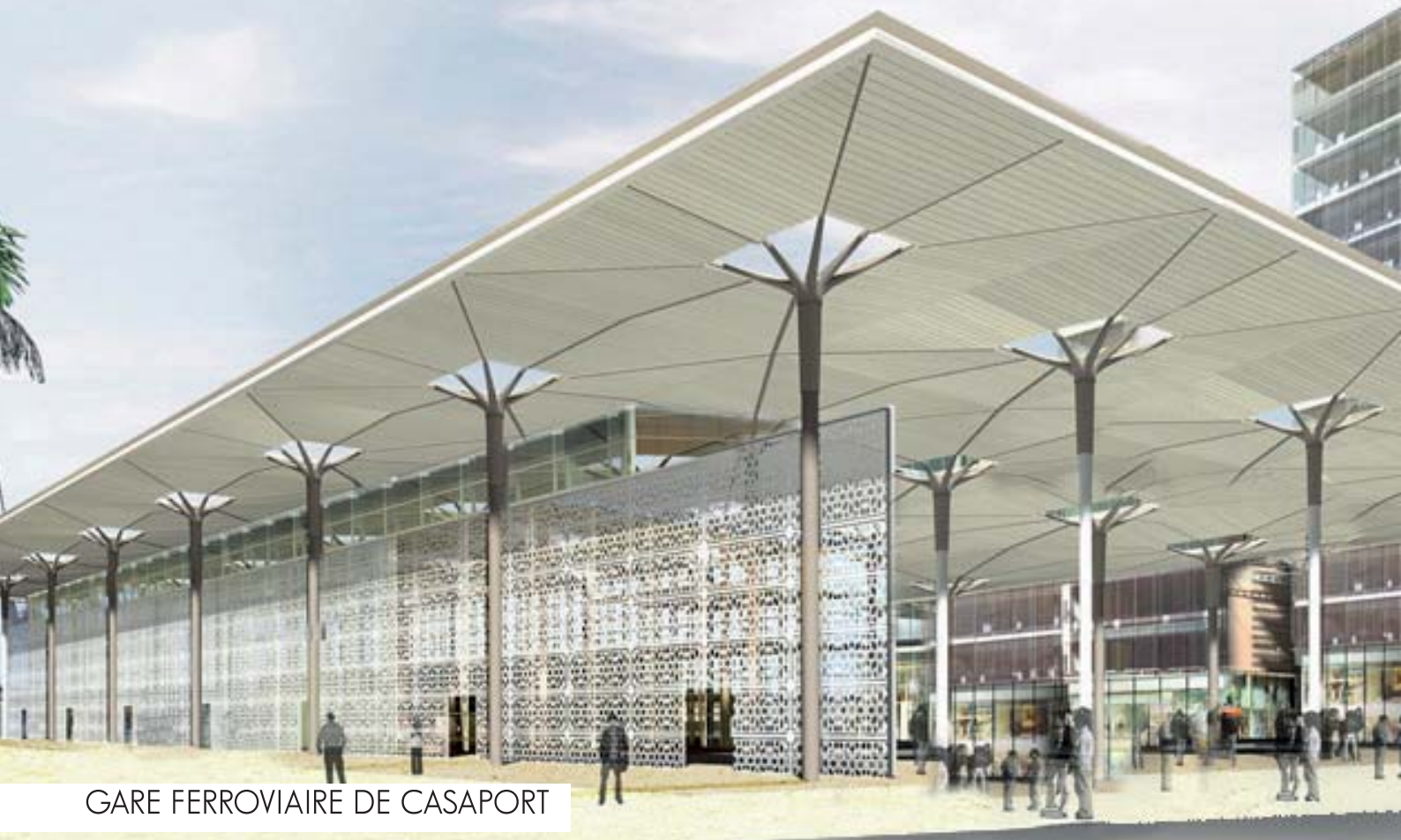
GARE FERROVIAIRE DE CASAPORT